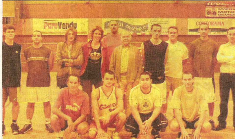
Les basketteurs ont rejoint le gymnase du Guillon depuis début septembre et ont repris les entraînements en attendant le début du championnat.

Toutes les rencontres à domicile des seniors auront lieu le samedi soir à 20h 30 au gymnase du Guillon (ouverture le 10 octobre face à Basket St Marcellin). □